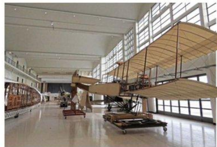
Le Bourget, hier. Les passionnés vont pouvoir redécouvrir l'aérogare historique et son architecture Art déco des années 1930.

Le journal Le Parisien a écrit deux articles sur le centenaire du Musée de l'Air. Vous y lirez, entre autres, que la Grande Galerie rouvrira ses portes en octobre ainsi que la tour de contrôle.