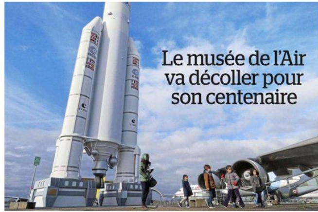
Le Bourget, hier. Près de 195 000 personnes ont visité le musée de l'Air et de l'Espace l'année dernière.

Afin de pouvoir accueillir le public, la tour de contrôle a été restaurée mais dotée d'un ascenseur.